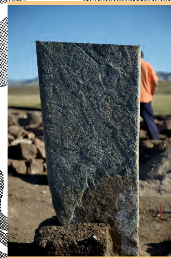
Нижний фрагмент оленного камня №7. Ушкийн увэр, 2013