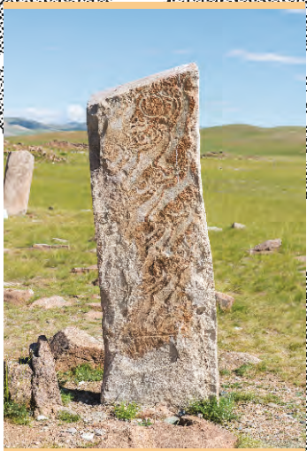
AR – Модель оленного камня №2. Ушкийн увэр, 2013

Используйте экран устройства для управления моделью