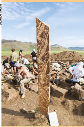
AR – Модель оленного камня №9. Ушкийн увэр, 2013