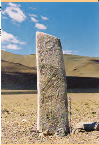
AR – Модель оленного камня №2 «саяно-алтайского» типа. Хар говь, 2001