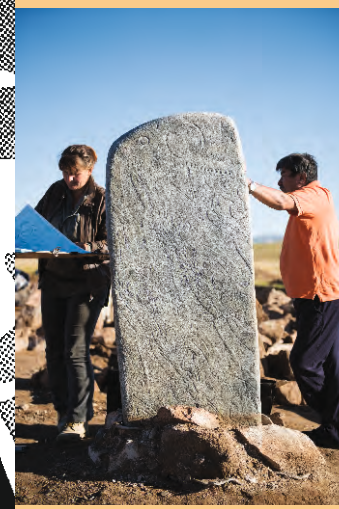
AR – Модель оленного камня №7, составленная из двух фрагментов виртуально. Ушкийн увэр, 2013