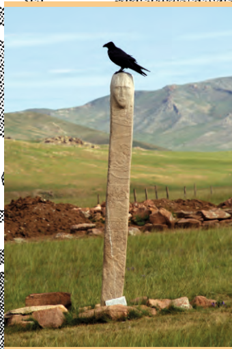
AR – Модель оленного камня №14. Ушкийн увэр, 2013